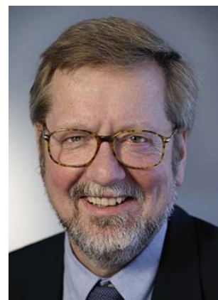
Per Stig MØLLER

Minister für Auswärtige Angelegenheiten Minister for Foreign Affairs Ministre des Affaires étrangères