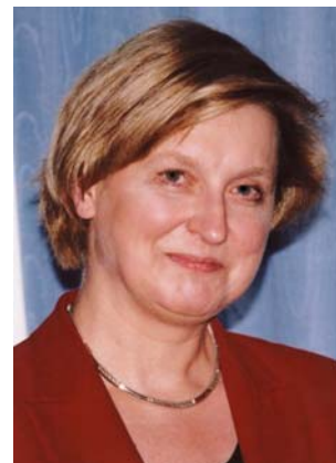
Anna Elżbieta FOTYGA

Ministerin für Auswärtige Angelegenheiten Minister for Foreign Affairs Ministre des Affaires étrangères