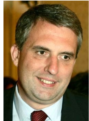
Ivailo Georgiev KALFIN

Minister für Auswärtige Angelegenheiten Minister for Foreign Affairs Ministre des Affaires étrangères