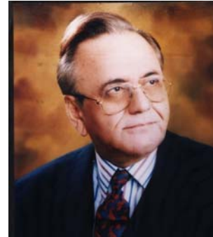
Khurshid M. KASURI

Minister für Auswärtige Angelegenheiten Minister for Foreign Affairs Ministre des Affaires étrangères