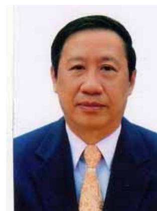
Pham Gia KHIEM

Minister für Auswärtige Angelegenheiten Minister for Foreign Affairs Ministre des Affaires étrangères